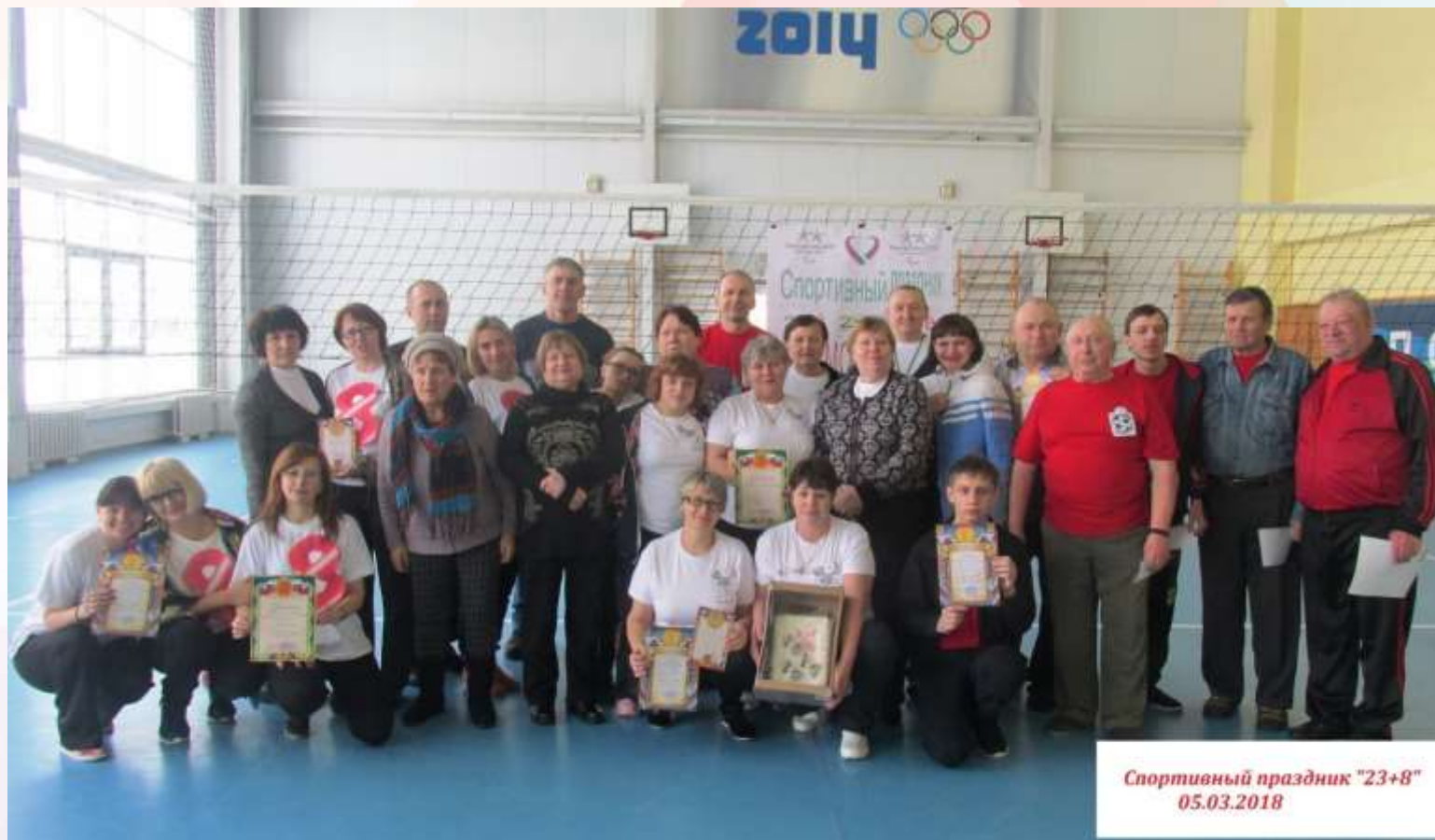
Спортивный праздник "23+8" 05.03.2018

Спортивный праздник 23+8 посвященный Дню защитника отечества и Международному женскому дню 8 марта 05.05.2018(32 человека)в соревновании приняли участие 2 команды ТМО ВОИ и команда специалистов отделения социальной реабилитации инвалидов БУ «КЦСОН «Ивушка» Тюкалинского района»