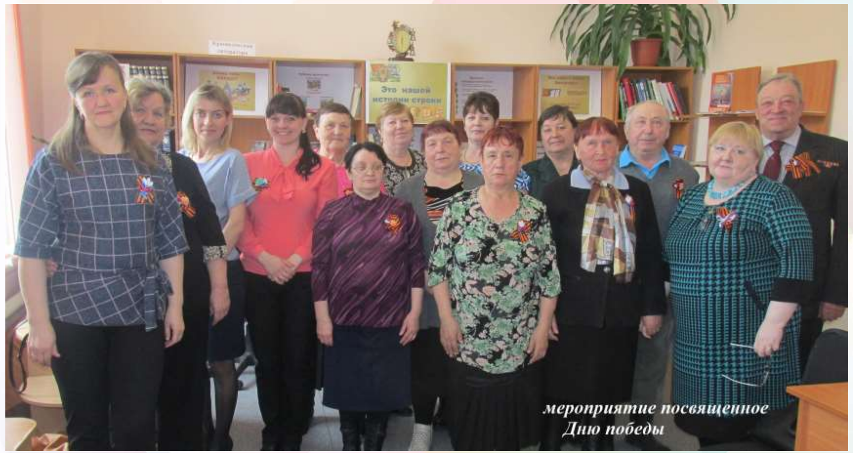
мероприятие посвященное Дню победы